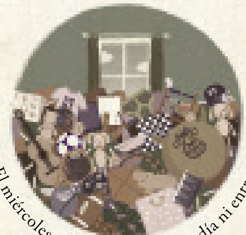
El miércoles en su cuarto no se podía ni entrar.

Mamá cruzó los brazos y se puso a su lado. –Sidney, ¿no te acuerdas de lo que habíamos hablado? Pero la cabeza de Sid algo estaba tramando y pronto respondió sin dejarle seguir hablando: