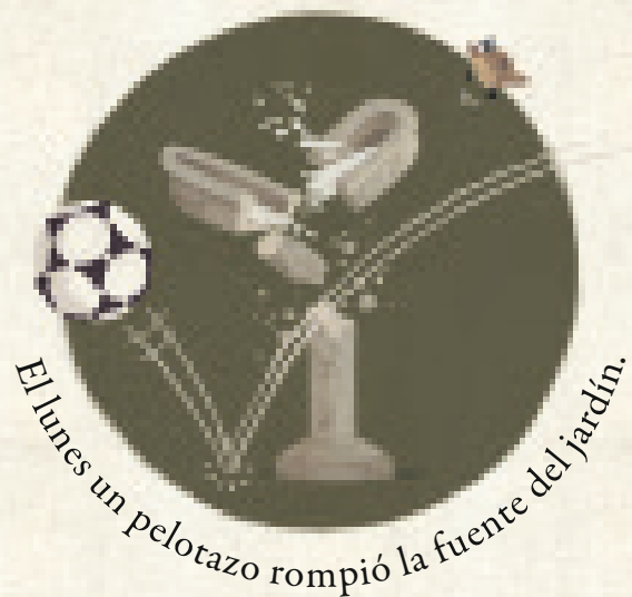
El lunes un pelotazo rompió la fuente del jardín.