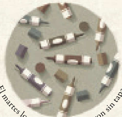
El martes los rotuladores quedaron sin tapar.