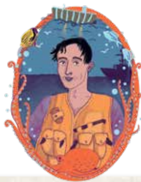
JACQUES PICCARD: P. 38

Tres años es lo que duró la expedición más larga de Ranulph, un explorador de gran renombre.