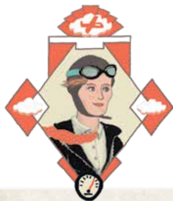
AMELIA EARHART: P. 14

Cherry viajó a la Antártida en una expedición científica.