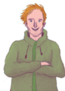
ALASTAIR HUMPHREYS: P. 8

Ante este joven proyecto de aventurero o aventurera se abre un mundo entero de oportunidades.