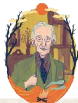
WILFRED THESIGER: P. 72

Dervla soñó durante veinte años con emprender un viaje en bicicleta hasta la India y al final lo consiguió.