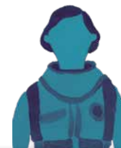
AVENTURERO/A DESCONOCIDO/A: P. 92

Tras hacerse a la mar en una balsa construida con sus propias manos, Thor fue a la deriva por el océano Pacífico hasta alcanzar las islas de la Polinesia.