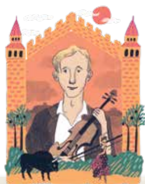
LAURIE LEE: P. 18

Gracias a su determinación, Nellie Bly dio la vuelta al mundo en solo setenta y dos días.