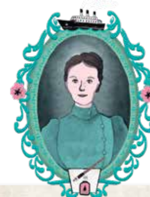
NELLIE BLY: P. 68

Lakpa, que es guía de montaña, ha trepado hasta el punto más alto del planeta la increíble cantidad de diecisiete veces.