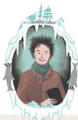
APSLEY CHERRY-GARRARD: P. 10

Cherry viajó a la Antártida en una expedición científica.