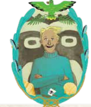
THOR HEYERDAHL: P. 88

Con solo dieciséis años, Sacagawea condujo a los famosos expedicionarios Lewis y Clark a lo ancho de Norteamérica.