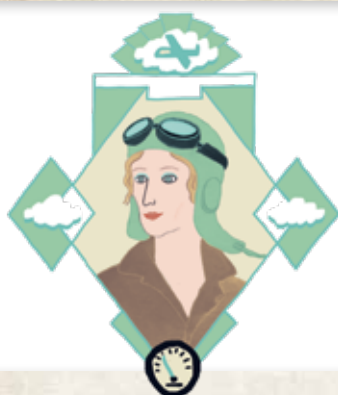
BERYL MARKHAM: P. 14

Tras convertirse en la primera mujer en atravesar el océano Atlántico volando en solitario, Amelia desapareció misteriosamente.