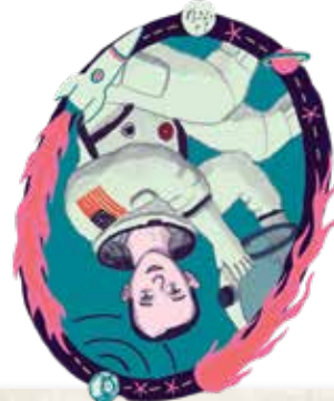
MICHAEL COLLINS: P. 42

El aventurero y submarinista Jacques Piccard visitó el punto más profundo de la Tierra.