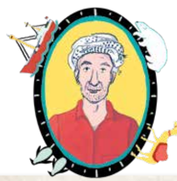
RANULPH FIENNES: P. 32