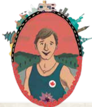
RICK HANSEN: P. 22