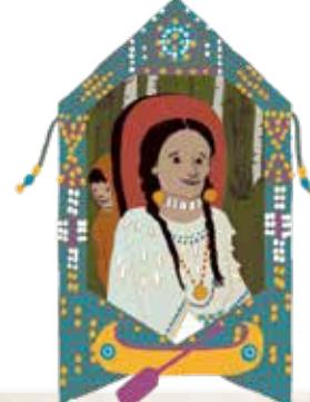
SACAGAWEA: P. 84

Como participante en la histórica misión Apolo 11, Michael fue una de las primeras personas en viajar hasta la Luna.