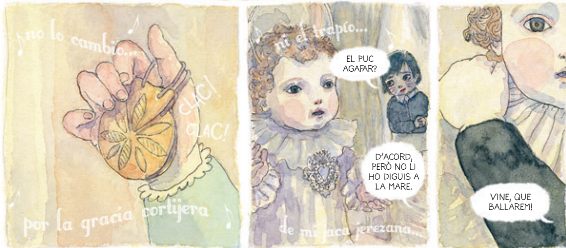
* Mi jaca, cantada per Estrellita Castro, una cançó molt popular als anys trenta.